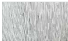
White Black Spark