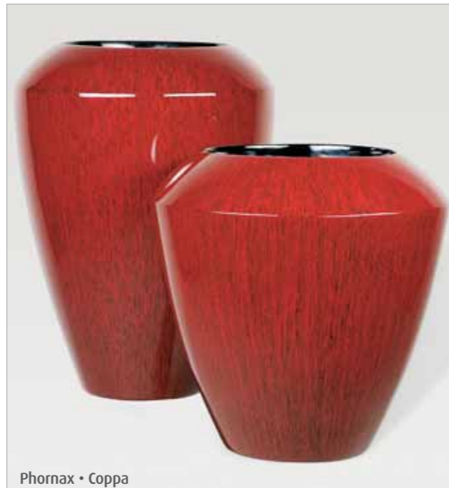
Phornax • Coppa