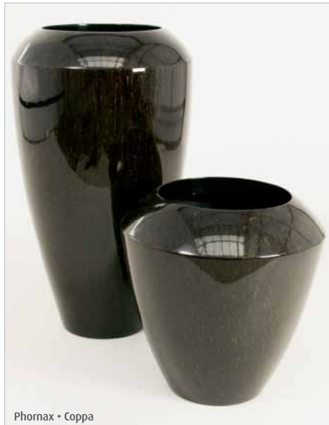
Phornax • Coppa