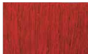
Red Black Spark