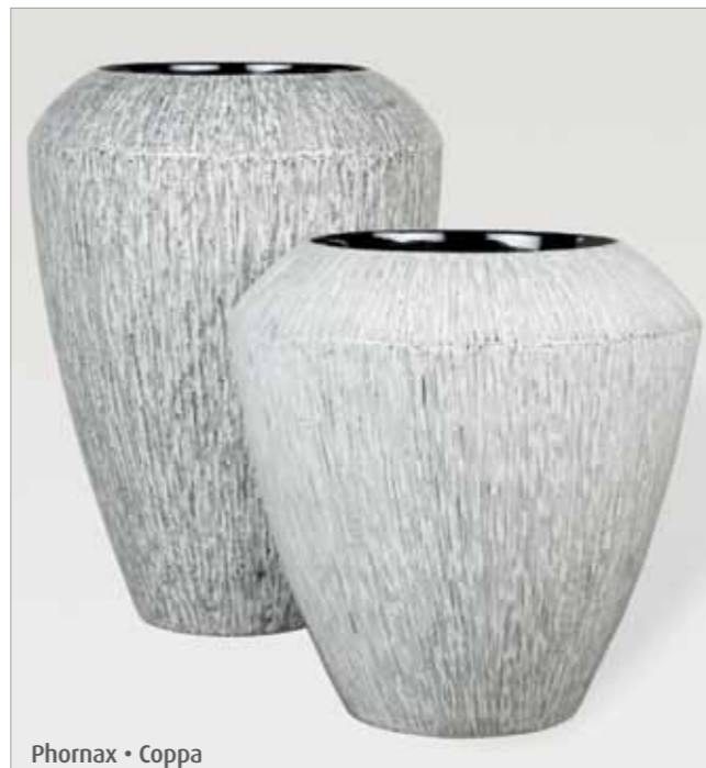
Phornax • Coppa