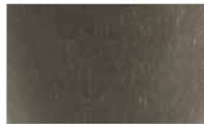
Black Gold Spark